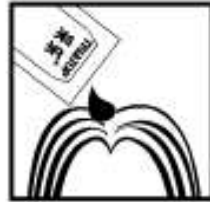
2.将5ml采乐,涂于发根及头发上