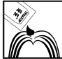
2.将5ml采乐,涂于发根及头发上