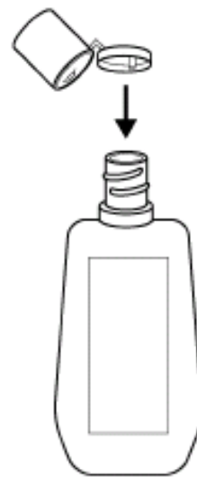
用内侧的突起按住薄膜,用力压出一孔,即可使用。